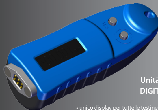
Unità display DIGITALE